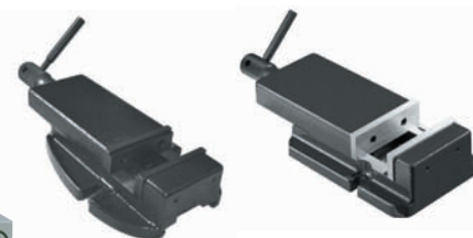
Etau EP 100 BF

N'hésitez pas à nous soumettre votre projet, ensemble nous trouverons la solution !