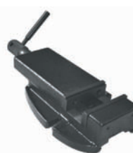
Etau EP 100 BF