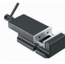
Etau EP 120 BF