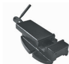
Etau EP 100 BF