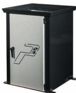
SOCLE P23 avec porte et tablette