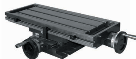
CHLNF 32 & CHLPF 32